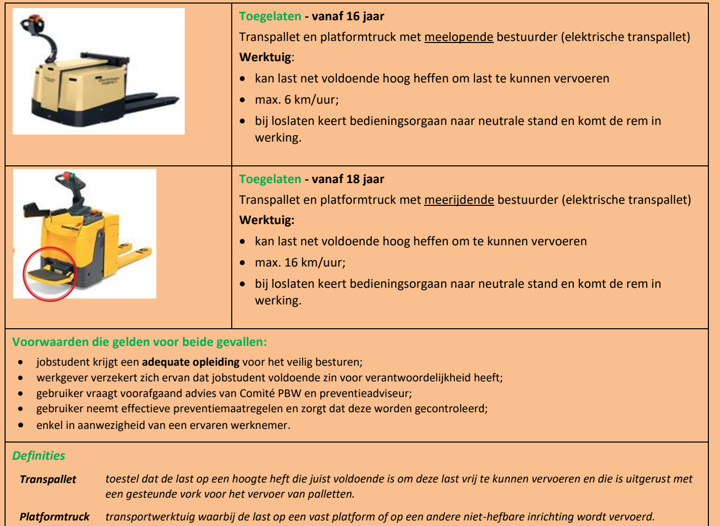
Tabel 2: Uitzonderingen m.b.t. bediening van “gemotoriseerde toestellen” (Codex, art. X.3-11/1)